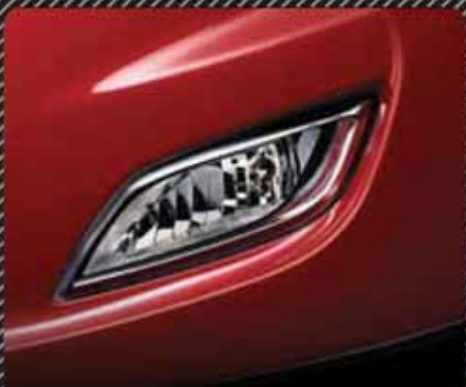
مه شکن جلو