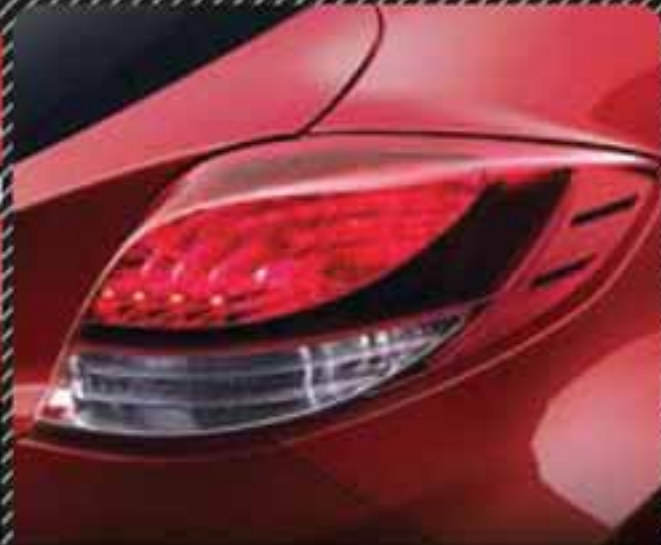
چراغ های عقب مجهز به LED