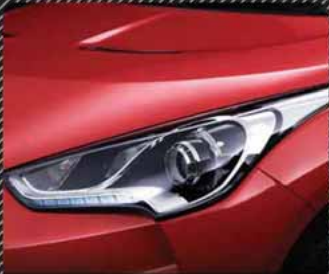
چراغ های جلو مجهز به LED