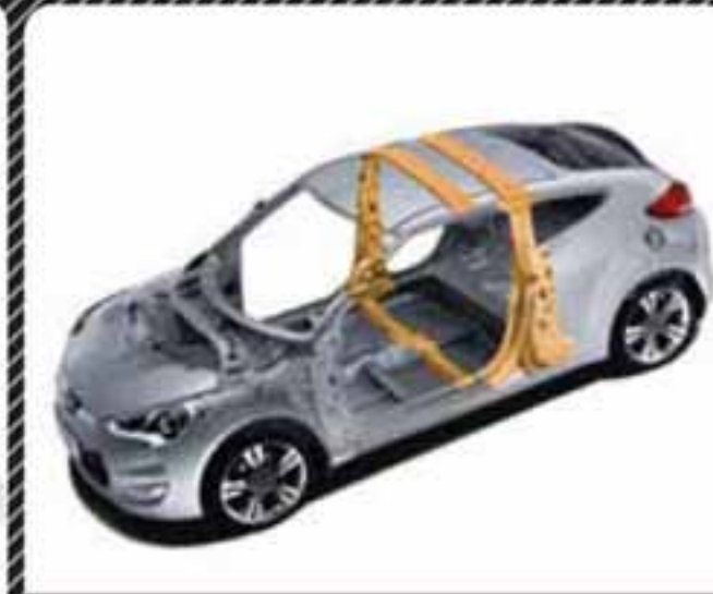
سازه و ستون فولادی B شکل به جهت افزایش ایمنی و مدیریت ضربه در تصادفات