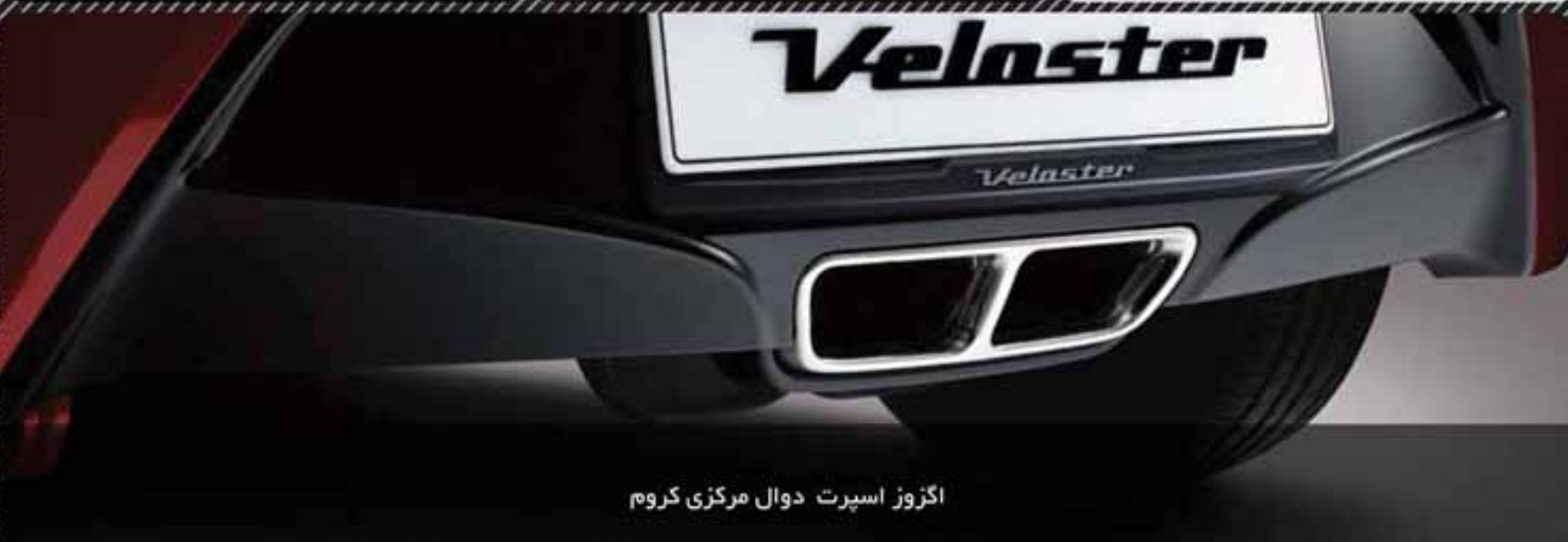
اگزوز اسپرت دوال مرکزی کروم