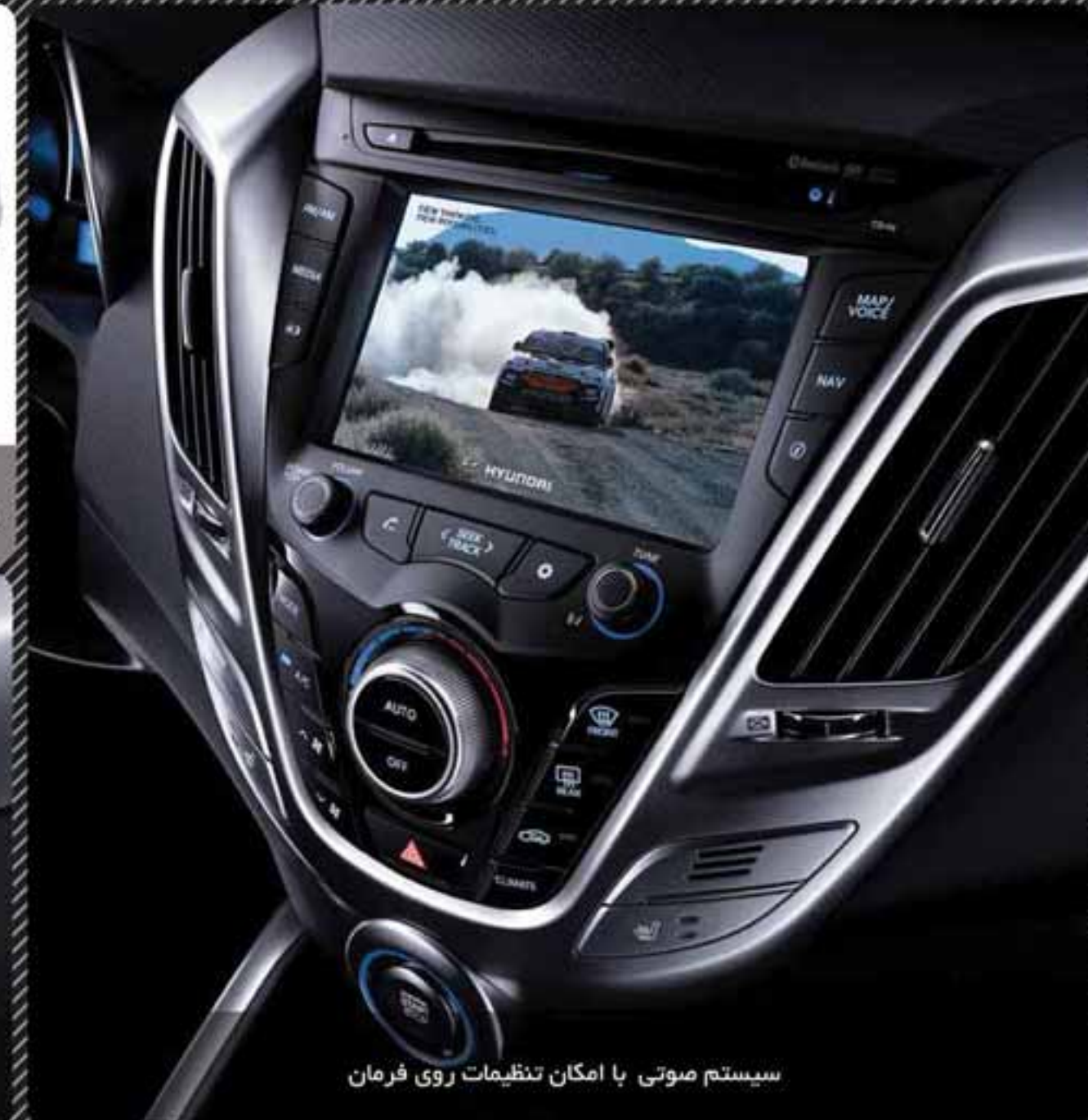
سیستم صوتی با امکان تنظیمات روی فرمان