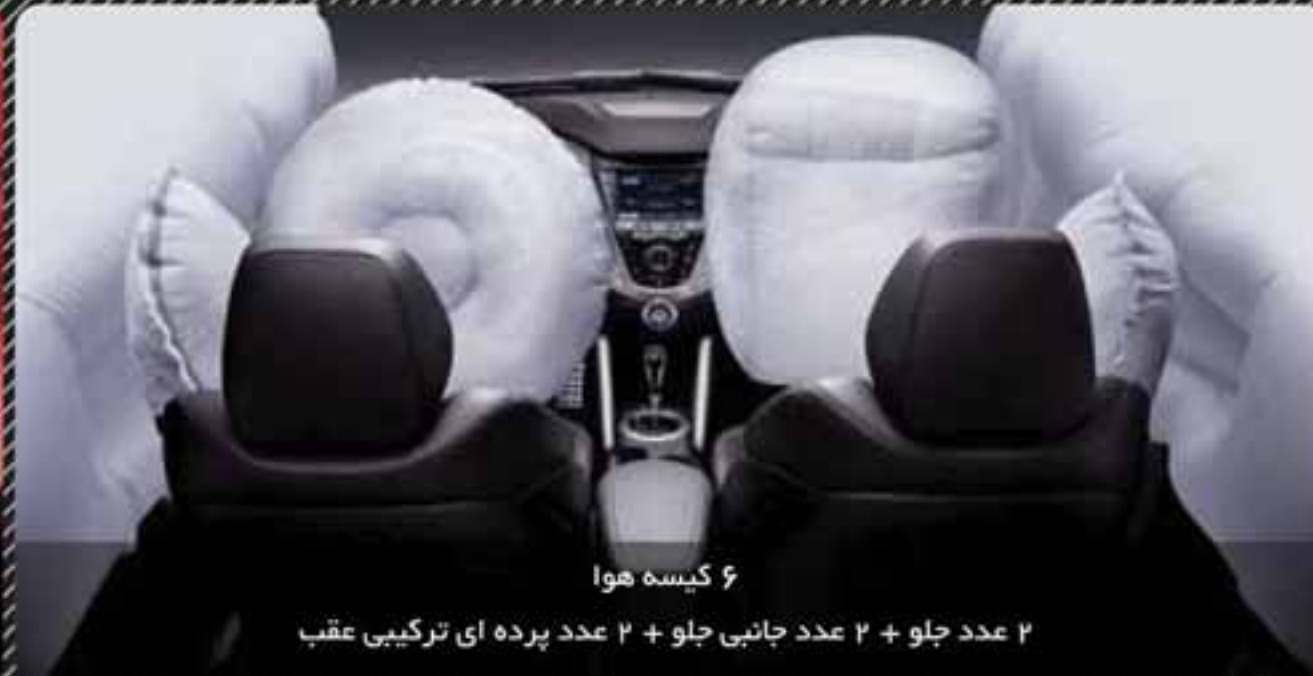
۶ کیسه هوا ۲ عدد جلو + ۲ عدد جانبی جلو + ۲ عدد پرده ای ترکیبی عقب