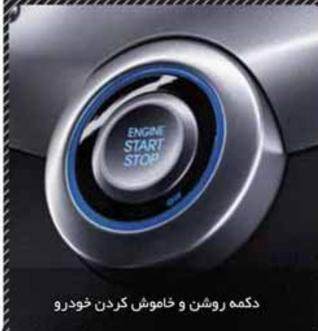
دکمه روشن و خاموش کردن خودرو