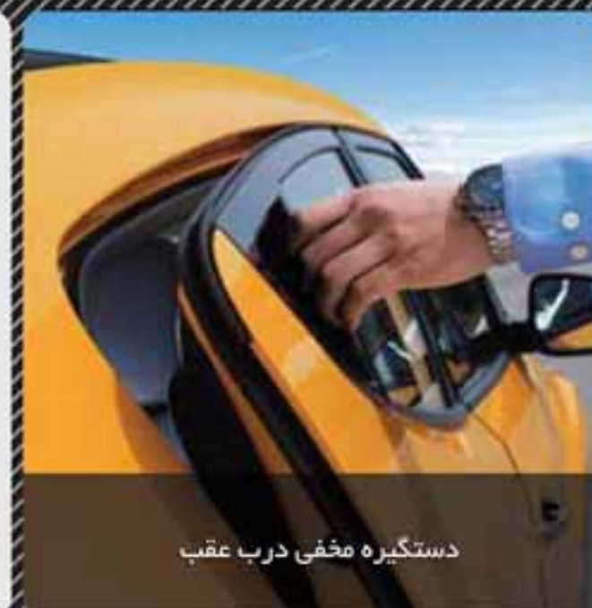
دستگیره مخفی درب عقب